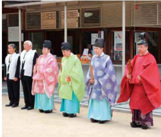
10月15日例祭 社務所前にて 宮司以下 齋員 列立