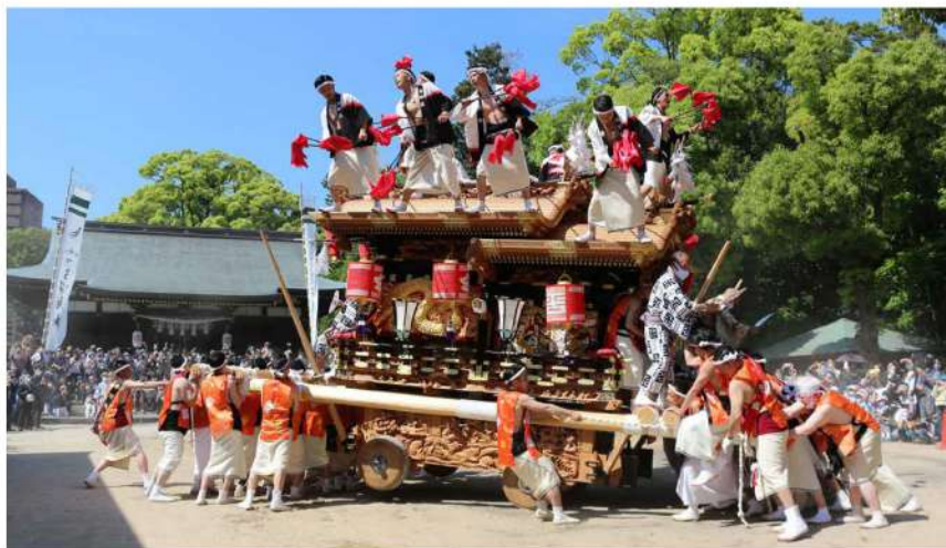
令和4年5月4日 平野新調地車 初めての宮入